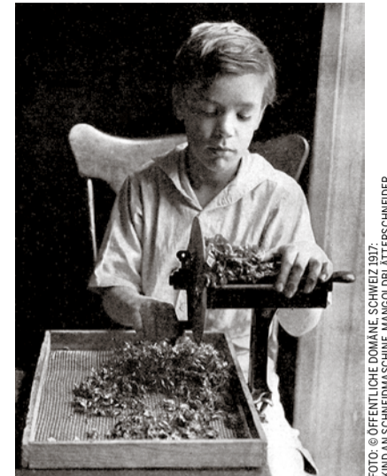
KINDER-SCHNEIDMASCHINE, MARGOLAT-FISCHNER

Bis in die 70er Jahre des letzten Jahrhunderts waren in der Schweiz zahlreiche Kinder und Jugendliche sowie junge Frauen und Männer von fürsorglichen Zwangsmassnahmen und Fremdplatzierungen betroffen. Auch die reformierten Kirchen und Pfarrpersonen waren am Fremdplatzierungswesen beteiligt. Noch ist hier die Aufarbeitung erst am Anfang. Je nach Zeit und Region waren bis zu fünf Prozent der Kinder und Jugendlichen in einer Fremdunderbringung zuhause. Viele von ihnen wurden verdingt, das heisst sie wurden als billige Arbeitskräfte eingesetzt. Wie auch die Gemeinde Spiez beteiligt sich die Ref. Kirchgemeinde Spiez am Berner «Zeichen der Erinnerung» (ZEDER), und will sich damit der Verantwortung gegenüber Betroffenen stellen.