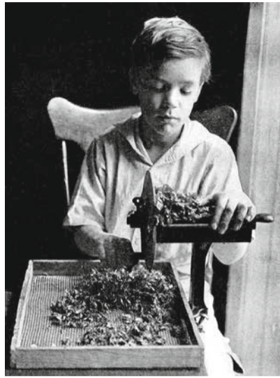
KIND AN SCHNEIDMASCHINE, MANGOLBLÄTTERSCHNEIDER