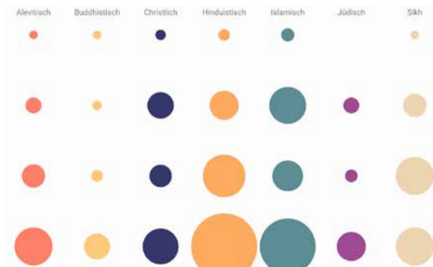
Rund 330 Anlässe wöchentlich werden angeboten, für rund 30000 Besuchende.

gründeten Gemeinschaften seien ausschliesslich christlich und jüdisch gewesen, heisst es im Bericht. Erst danach kamen weitere hinzu: buddhistische, hinduistische und islamische Gemeinschaften, solche von Sikhs und Aleviten und andere mehr. Aber auch christliche sind unter den privatrechtlich organisierten Gemeinschaften zu finden: Etwa 63 Prozent der Befragten sind freikirchlich. Weniger Kultur, mehr Feiern Weitere Angaben macht der Bericht zur Grösse der Gemeinschaften, zur Organisationsform – es sind vor allem Vereine, aber auch ein paar Stiftungen –, zu den Angeboten und zur Finanzierung. Im Gegensatz zu den öffentlich-rechtlichen existieren die Befragten vorab durch Spenden oder Mitgliederbeiträge. Das hat direkte Auswirkungen auf die Angebote der Gemeinschaften: Kulturelle Anlässe und Vernet-